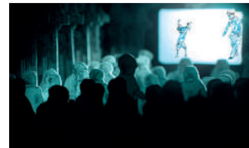
Mr Sand | Soetkin Versetegen | 2016

O cinema produzido e pensado para Guimarães encontra nestas sessões as orientações do Bando à Parte e do Cineclub de Guimarães.