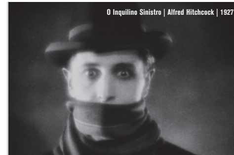
O Inquilino Sinistro | Alfred Hitchcock | 1927