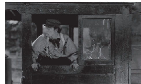
Pamplinas Maquinista | Buster Keaton e Clyde Bruckman | 1926