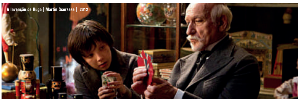
A Invenção de Hugo | Martin Scorsese | 2012

Playtime – Vida Moderna | Jacques Tati | 1967 | 115 min | M/12