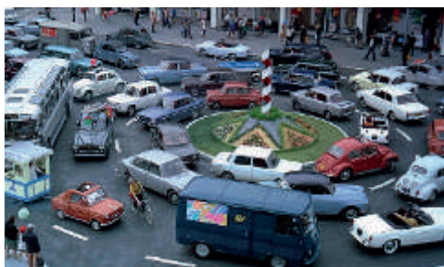
Playtime – Vida Moderna | Jacques Tati | 1967