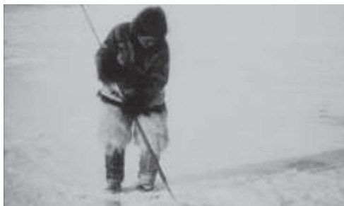
Nanook, o Esquimó | Robert Flaherty | 1922