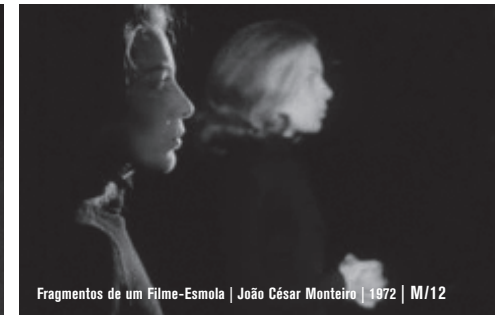
Fragmentos de um Filme-Esmola | João César Monteiro | 1972 | M/12