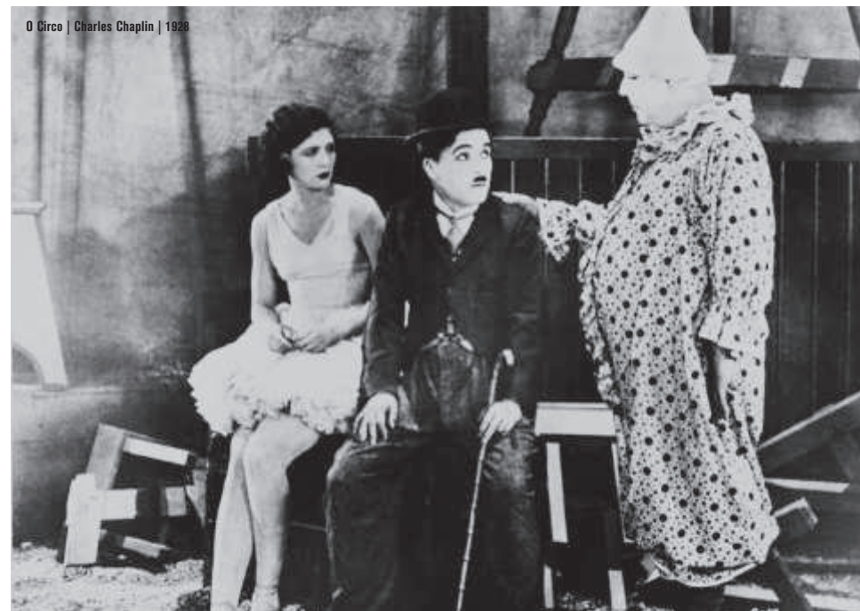
O Circo | Charles Chaplin | 1928

As Aventuras do Príncipe Achmed | Lotte Reiniger | 1926 | 66 min | M/6